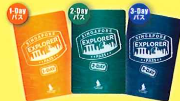
シンガポール・エクスプローラー・パス(見本)